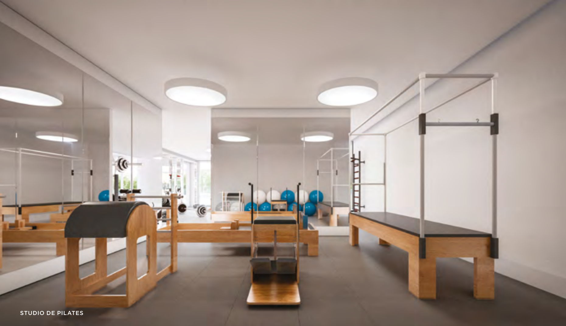
STUDIO DE PILATES